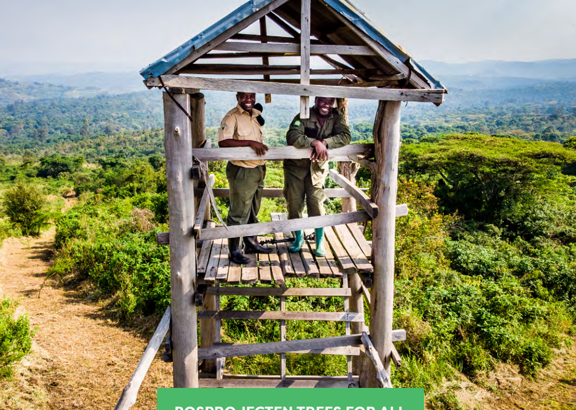
BOSPROJECTEN TREES FOR ALL